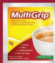
Multigrip Sachê 5g