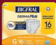
Fralda Bigfrol Derma Plus Econômica G 16 unidades