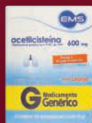
Acetilcisteína 600mg 16 envelopes