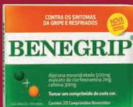
Benegrip 20 comprimidos