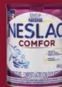
Neslac Comfor 800g