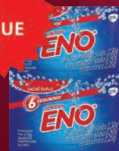
Sal Fruta Eno 2 envelopes