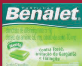
Benalet 12 pastilhas