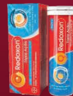
Redoxon Tripla Ação 10 comprimidos efervescentes