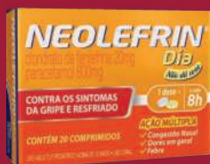
Neolefrin Dia 800 20mg 20 comprimidos