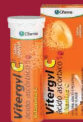
Viterygl C 10 comprimidos efervescentes